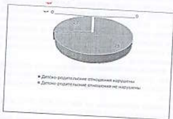
Результаты интерпретации рисунков детей (рис. 1)

Анализ результатов таблицы, показывает, что в 8 (73%) семьях присутствуют нарушения детско-родительских отношений, в 3 (27%) семьях таких нарушений не наблюдается.